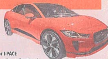
Jaguar I-PACE

MONDIAL DE L'AUTO Huit pages sur les stars du salon 2018 Cahier central